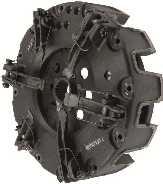
Fig. 1: frizione