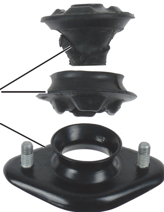
Fig. 1: Cuscinetto di supporto per montante telescopico intatto con parti applicate