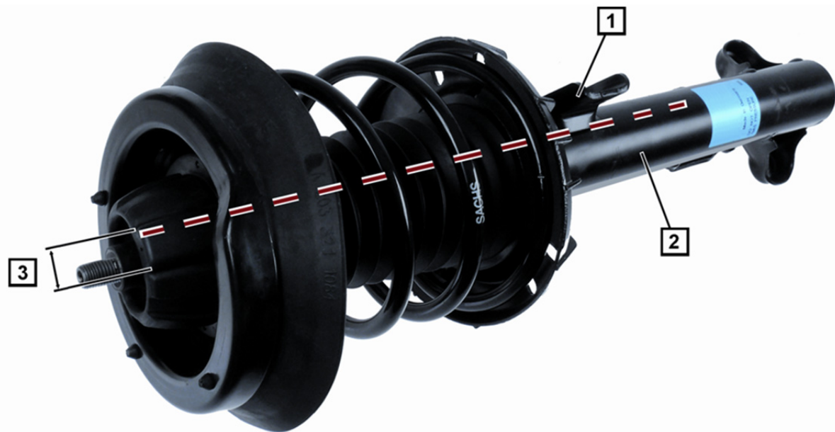
Sl. 1: Opružna noga