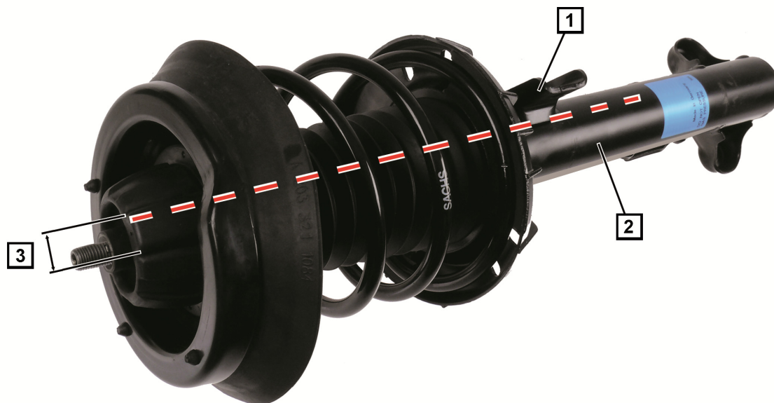
Fig. 1: Fjærbein