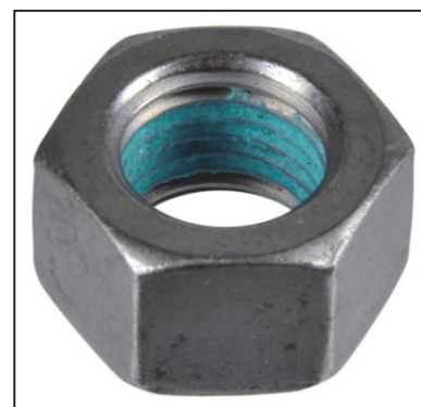
Fig. 2: tuerca M14x1,5 con seguro químico para roscas