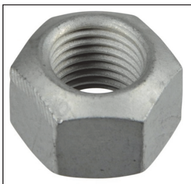
Fig. 1: tuercas autoblocantes totalmente de metal M14x1,5