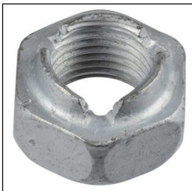
Figure 2 : écrou frein filet pré-enduit M14x1,5