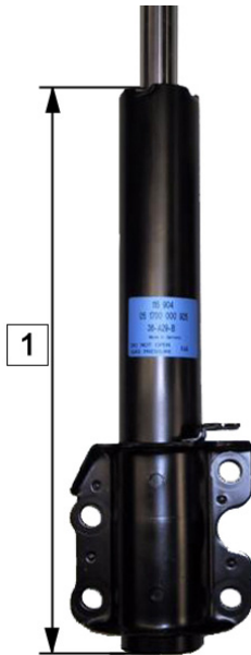
Fig. 1: eje delantero

N.º art.: 32-H60-0, 32-H61-0, 32-H62-0, 32-H63-0, 32-G71-0, 32-H81-0