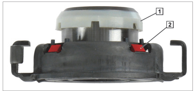
Fig. 2: Cojinete de desembrague