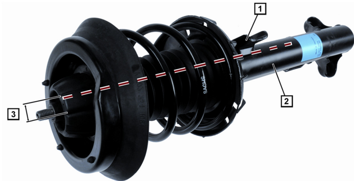
Sl. 1: Opružna noga