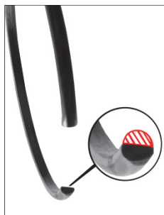
Sl. 3: Sigurnosni prsten je istrošen. → Isključna poluga se odvaja od membranske opruge → naglo sprezanje