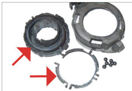
Sl. 4: Mehanička oštećenja i pregrevanje na isključnoj polugi