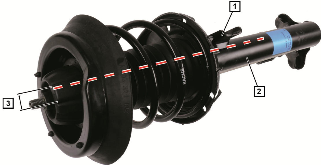
Fig. 1: Fjederben