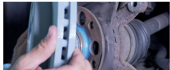
NOxidation für mehr Beweglichkeit

Die freie Beweglichkeit der Bremsbeläge ist für eine optimale Bremsleistung unerlässlich. Genauso wichtig ist es aber, dass sich nach dem Bremsvorgang das notwendige Lüftspiel zwischen Belag und Scheibe wieder einstellt. NOxidation sorgt dafür, dass die Beläge nicht in den Belagführungen festsitzen und sich stets frei bewegen können. Dies trägt zur Reduzierung des Kraftstoffverbrauchs bei und reduziert die Bildung von Bremsstaub. So leistet unser Fett auch einen Beitrag zu mehr Umweltschutz.