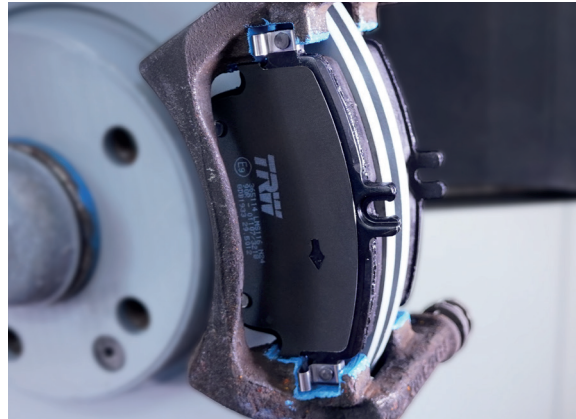
Schnelle und saubere Reparatur

Ein weiteres herausragendes Merkmal von NOxidation ist die Vereinfachung der Demontage der Bremskomponenten bei einer anfallenden Reparatur. Durch die spezielle Formulierung des Fetts wird ein Festfrieren der Teile verhindert, was Wartungsarbeiten erheblich erleichtert und damit Zeit spart. Darüber hinaus zeichnet sich NOxidation durch eine hohe thermische Bandbreite aus. Das Fett bleibt auch bei extremen Temperaturen, sei es in kalten Wintern beim „Bordsteinparker“ oder bei Dauerbelastung der Bremse, stabil und wirksam.